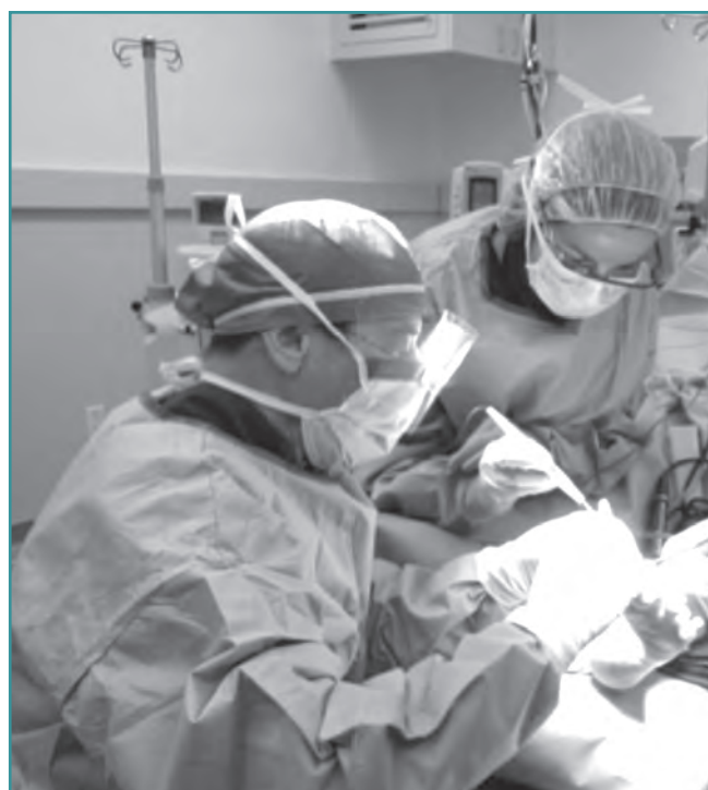
Figura 1. En el quirófano, participando en la cirugía junto con el Dr. Brodsky.

Dos días a la semana se realizaba la actividad quirúrgica , un día para los quirófanos de cirugía ambulatoria y otro para