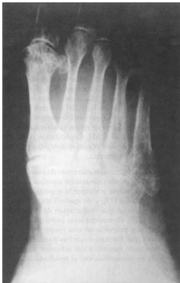
Fig. 4. Cambios degenerativos articulares en una fractura-luxación de Lisfranc parcial externa tratada mediante reducción cerrada y fijación percutánea con agujas de Kirschner.

Algunos autores dicen que los cambios degenerativos son inevitables (9, 10) e incluso que no representan ninguna influencia en los resultados finales utilizando los diferentes tratamientos quirúrgicos (12). De los 6 casos con resultado final bueno, 3 (50%) presentaban signos degenerativos y todos los casos con resultado medio y malo (excepto los que sufrieron una amputación) presentaban signos degenerativos.