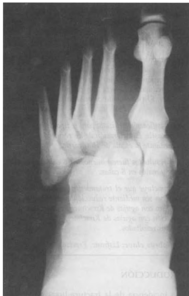
Fig. 1. Fractura-luxación parcial externa con desplazamiento de los MTT hacia lateral excepto del 1 er MTT.

Se ha objetivado el mecanismo lesional. La clasificación de Quénu y Küss modificada por Hardcastle (9) ha sido la utilizada para describir el tipo de fractura-luxación de Lisfranc mediante proyecciones radiológicas en el momento del ingreso (Tabla I).