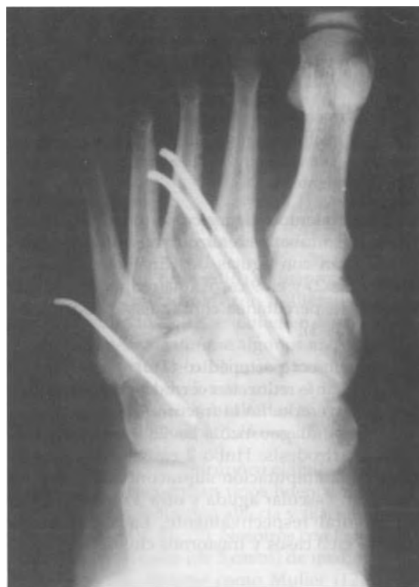
Fig. 2. Reducción abierta y fijación interna con 3 agujas de Kirschner en una fractura-luxación de Lisfranc parcial externa.

El mecanismo lesional fue en 8 casos un accidente de tráfico (ATF) y en 10 casos una caída desde altura. Asociaron lesiones en el mismo pie 11 casos y en el contralateral 2 casos (Tabla IV).