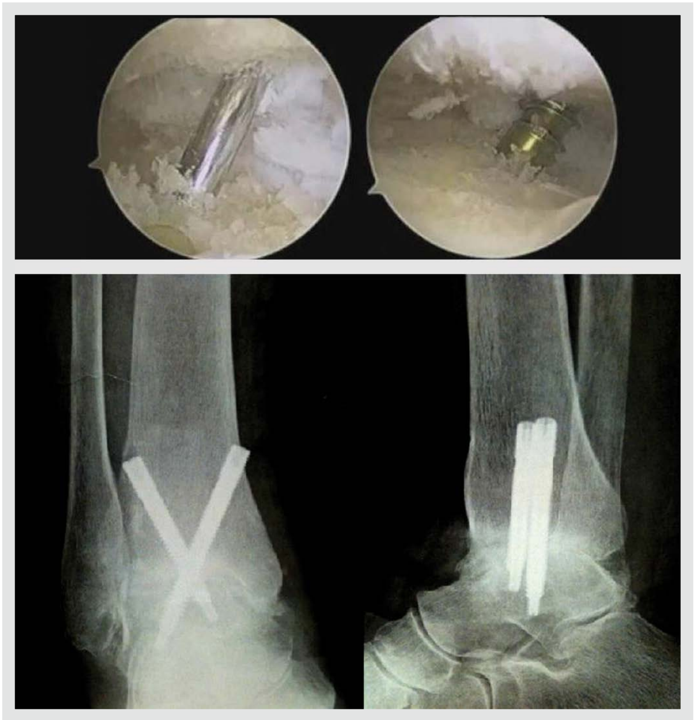
Figura 4. Artrodesis tibioastragalina artroscópica. Preparación de las superficies articulares, desbridamiento del cartílago y fresado del hueso subcondral escleroso. Radiografías anteroposterior y lateral en las que se objetiva la consolidación de la artrodesis.

tante, recientes estudios biomecánicos abogan por la colocación de 3 tornillos paralelos tibio-astragalinos mediales 24 , con lo que se objetiva una consolidación estadísticamente significativa más precoz con esta configuración.