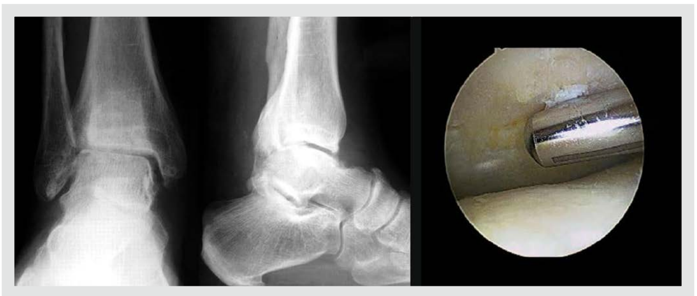
Figura 3. Desbridamiento artroscópico en una artrosis grado 2.

Parece existir una correlación entre los resultados clínicofuncionales y el grado de artrosis radiológica, que son satisfactorios en un 86% en el estadio 1 y en un 70% en el 2 6,7 . No obstante, algunos autores 7,8 muestran escasa mejoría con este procedimiento.