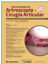
Imagen de portada