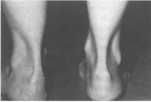
Fig. 1. Tumoración retropic visión posterior.

son inicialmente visibles en el talón por detrás, con el paciente de pie (Fig. 1). La presión del triángulo preaquileo resulta igualmente dolorosa.