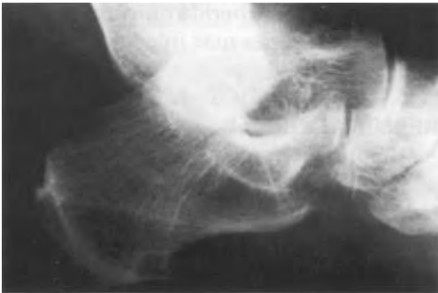
Fig. 2. Prominencia tuberosidad posterosuperior del calcáneo.

Las proyecciones radiográficas habituales muestran la existencia y tamaño de la prominencia ósea (6) (Fig. 2). En el estudio radiológico del calcáneo podemos describir varios ángulos. Uno formado por la línea trazada entre la tuberosidad anterior y medial del calcáneo y la línea determinada por la tuberosidad mayor del calcáneo (Fig. 3). Valores superiores a 75^\circ parecen ser patológicos (7) aunque el valor numérico no se correlaciona con la forma de presentación clínica.