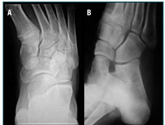
Figura 3. Radiografía anteroposterior (A) y oblicua (B) de pie tras la retirada de yeso a las 6 semanas. Se observa la congruencia articular entre calcáneo y cuboides.

El diagnóstico de certeza se obtiene con el estudio radiológico antero-posterior, lateral y oblicuo del pie afecto. En caso de duda, se deben realizar radiografías comparativas del pie contralateral (12) . A veces es necesario realizar la TAC con cortes longitudinales y coronales para valorar la extensión y la inestabilidad de la lesión, pudiéndonos dar el diagnóstico al pasar inadvertida la fractura en el estudio radiográfico (1) .