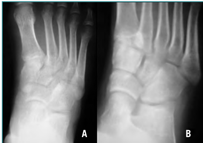
Figura 4. Proyección anteroposterior (A) y oblicua (B) de pie al final del seguimiento. Se mantiene la congruencia articular entre calcáneo y cuboides.

Figure 4. (A) Antero-posterior and (B) oblique X-rays of the foot at the end of the follow-up. The calcaneo-cuboid articular congruence persists.