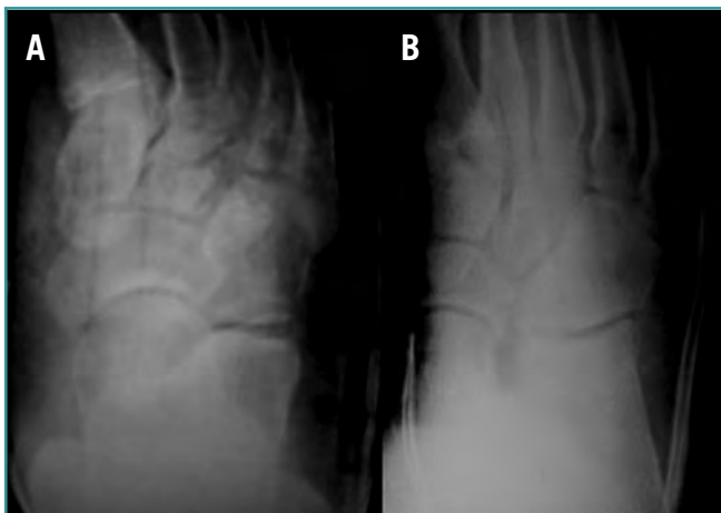
Figura 2. Proyección anteroposterior (A) y oblicua (B) de pie, tras la reducción cerrada y la inmovilización con botín de yeso. Figure 2. (A) Antero-posterior and (B) oblique X-rays of the foot after closed reduction and immobilization with plaster cast boot.

A los 3 meses de la luxación, el paciente inicia vida normal. Tras doce meses de seguimiento, juega al fútbol de forma habitual, sin presentar complicaciones a dicho nivel ( Figura 4 ).