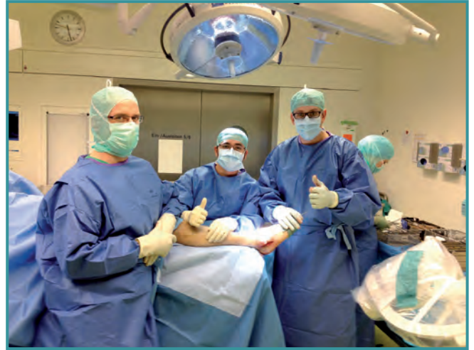
Figura 3. Algunos miembros del equipo.